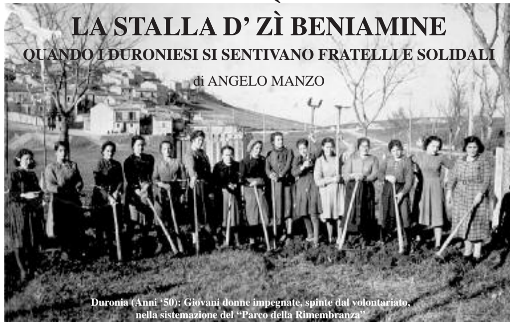
Duronia (Anni '50): Giovani donne impegnate, spinte dal volontariato, nella sistemazione del "Parco della Rimembranza"