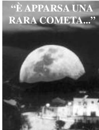
"È APPARSA UNA RARA COMETA..."