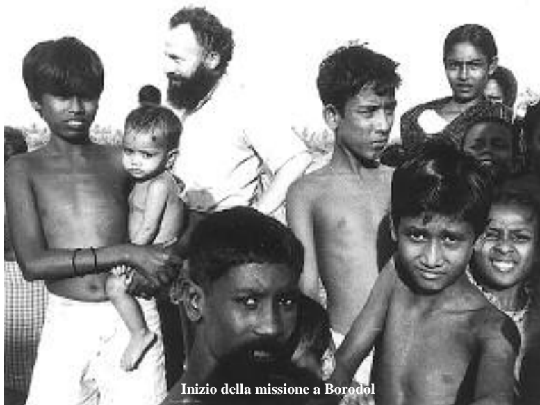
Inizio della missione a Borodol

A borodol sono arrivato di notte, alle 2.40 e cioè dopo 11 ore di viaggio in fiume per percorrere una distanza di quasi cento chilometri.