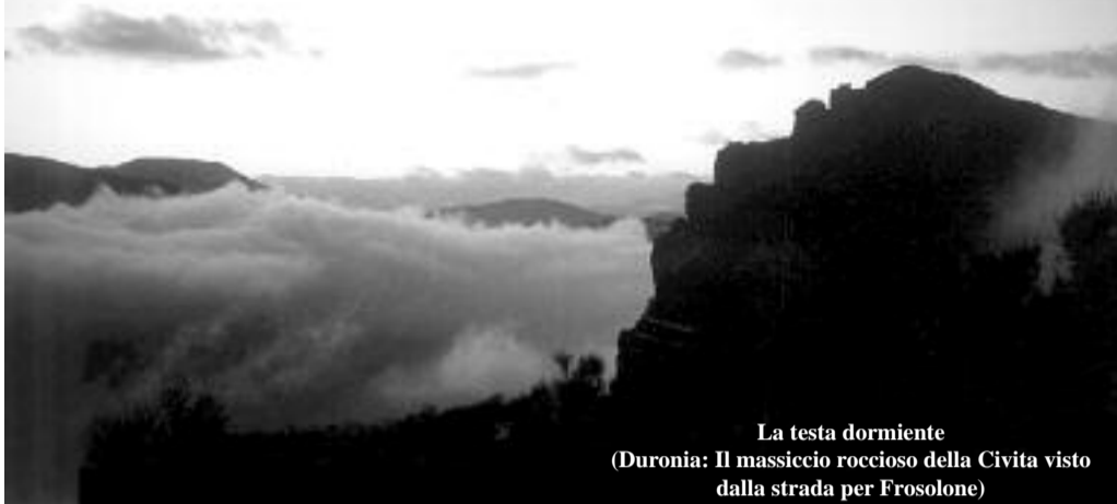
La testa dormiente (Duronia: Il massiccio roccioso della Civita visto dalla strada per Frosolone)

"... FARE CULTURA VUOL DIRE APRIRE GLI OCCHI, RIUSCIRE A VEDERE DA SOLI O INSIEME LE POSSIBILI STRADE CHE PORTANO LONTANO OLTRE IL SONNO DELL'ATTESA..."