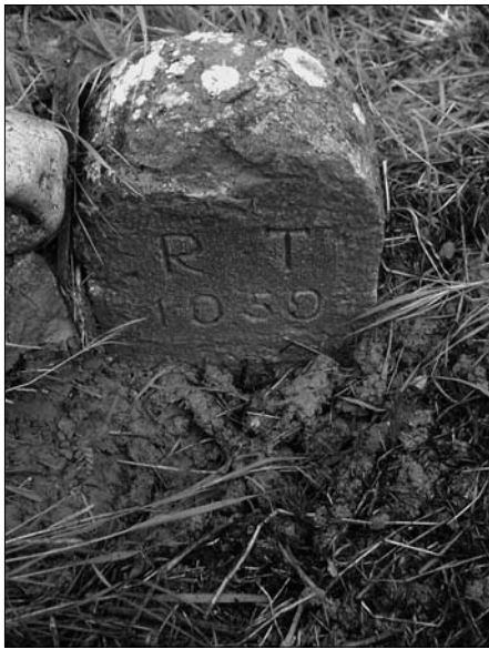
Figura 4 – Tratturo Pescasseroli-Candela nel comune di Rio-nero Sannitico (IS). Pietra miliare apposta nella Reintegra effettuata a metà del XVII secolo per evitare l'usurpazione del suolo tratturale una volta terminata la transumanza.

territorio, altrimenti non sfruttabile, permettendo di aumentare la ricchezza complessiva della nazione e, quindi, della monarchia che traeva profitti dal dare in appalto la gestione della Dogana.