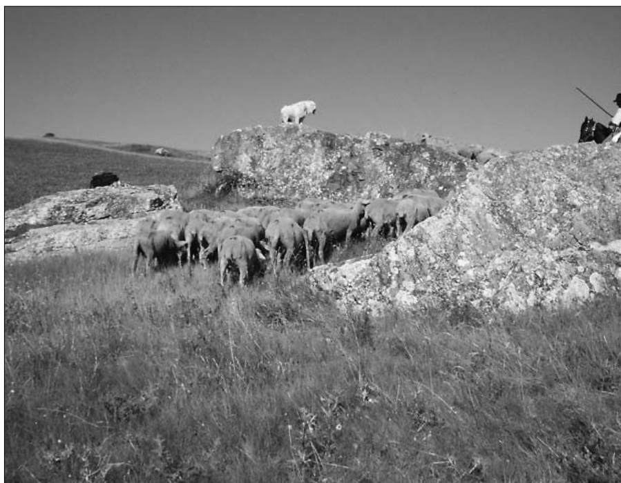
Figura 7 – Tratturo Castel di Sangro-Lucera in agro di Civitanova del Sannio (IS). Le emergenze rocciose, per la loro riconoscibilità nel territorio costituiscono dei segni identificativi del percorso dei tratturi, altrimenti privi di qualsiasi elemento di riferimento per coloro che li percorrono.

insieme a quello del bosco è complementare all'esercizio privato dell'attività agricola che, invece, si svolge in prevalenza ad altitudini inferiori. L'appartenenza al demanio comunale consente la regolamentazione del pascolo evitando che prepotenti proprietari di greggi abusassero dei pascoli comuni a danno del resto dei pastori. Le medesime esigenze di un utilizzo comunitario dei pascoli sono alla base della nascita della Dogana di Foggia.