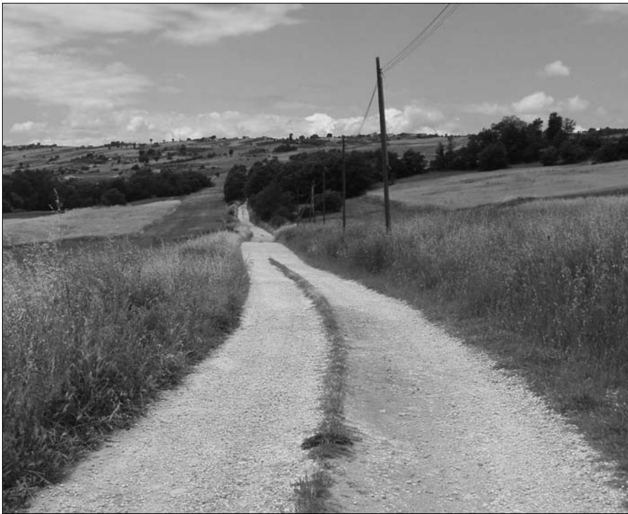
Figura 8 – Tratturo L'Aquila-Foggia nei territori di San Martino in Pensilis e Portocannone (CB). È visibile la "Via Regia", il percorso stradale che era inserito all'interno del tracciato tratturale e destinato alla percorrenza degli uomini e dei carri, mentre la fascia circostante era lasciata al pascolo delle greggi durante la transumanza.

In Italia le tracce più antiche, attribuite al Paleolitico, risalgono a 28 mila anni fa; quelle attribuite al Neolitico e sempre in Italia, a circa 8.000 anni fa.