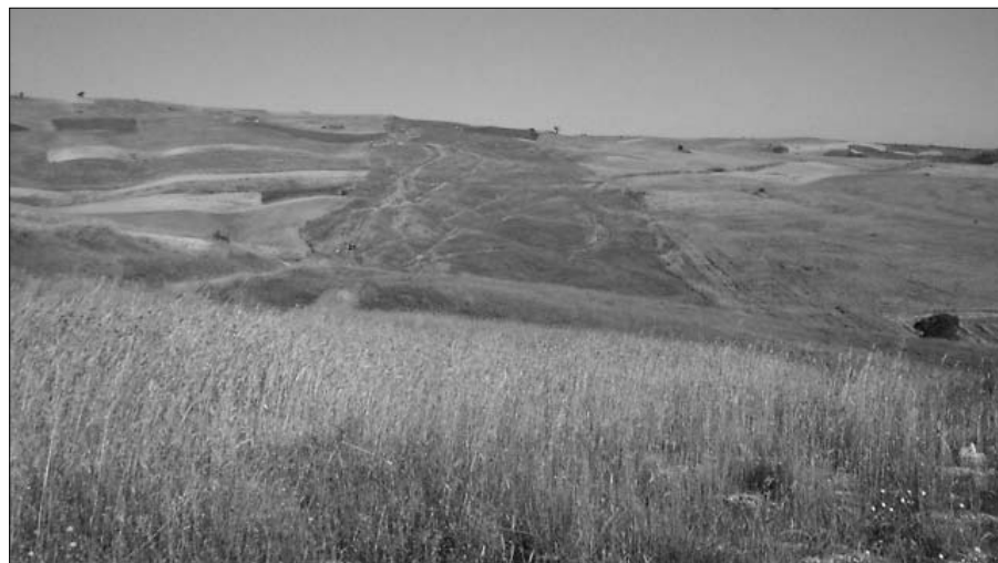
Figura 3 – Tratturo Celano-Foggia in agro di Ripabottoni (CB). Si legge il tracciato tratturale che è una fascia erbosa in contrapposizione ai campi coltivati a grano, coltura oggi esclusiva di queste zone la quale ha annullato i caratteri tradizionali del paesaggio agrario.