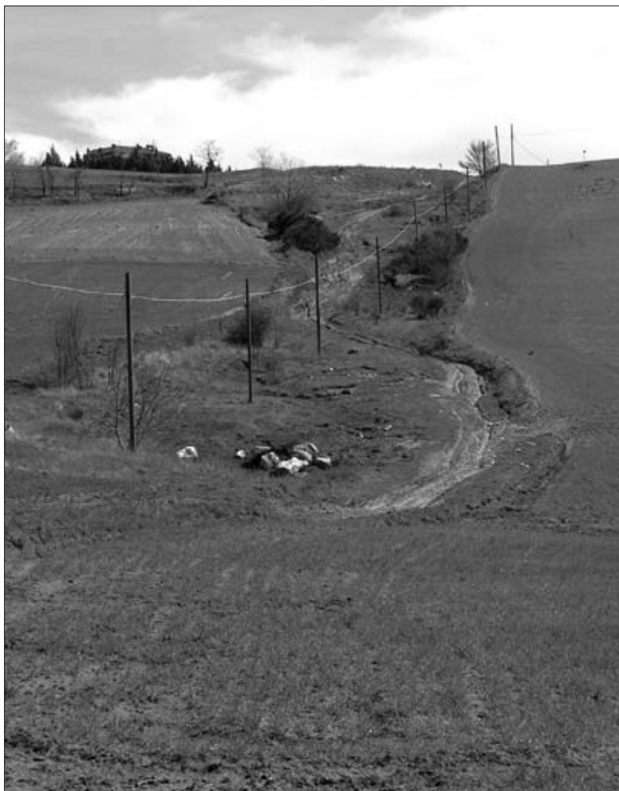
Figura 6 – Tratturo Castel di Sangro-Lucera nella frazione Santo Stefano nel comune di Campobasso. Il pascolamento prima e l'abbandono poi hanno portato al dilavamento del terreno per cui la fascia tratturale oggi è leggibile proprio per la presenza di fenomeni erosivi.