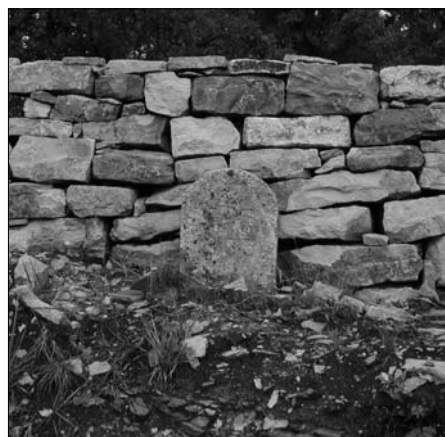
Figura 1 – Tratturo Pescasseroli-Candela in località Altilia di Sepino (CB), l'antica Saepinum nel territorio dell'odierna Sepino (CB). Cippo miliare nelle vicinanze della città romana che costituiva una tappa obbligatoria della transumanza perché nell'antico foro si svolgeva il mercato.

I tratturi, lunghe vie erbose larghe 111 metri che si sviluppano dall'Abruzzo alla Puglia, attraversando quindi il Molise, hanno una storia antica. Tra i primi documenti c'è l'iscrizione De Grege Oviarico sulla porta Boiano della città romana di Altilia (Sepino) di epoca imperiale (169-172 d.C.). Un'altra fonte è il De Rustica di Varrone ed è forse la più remota (è del I sec. a. C.).