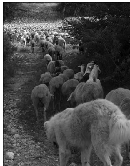
Figura 2 – Tratturo Celano-Foggia in agro di Lucito (CB). Attraversamento del fiume Biferno nel guado presso Morgia Schiavone. I fiumi molisani che vanno da ovest ad est costituiscono un ostacolo alla transumanza che invece si svolge da nord a sud.

Vengono, così, a cadere le ragioni della destinazione a pascolo del Tavoliere quale unico uso possibile di una zona arida. La transumanza era servita per utilizzare questo